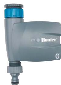
BTT-101 Einlaufdurchmesser: ¾" und 1" Auslaufdurchmesser: ¾" Höhe: 16,8 cm Breite: 12 cm Tiefe: 6 cm

Bluetooth®-Wortmarke und Bluetooth-Logos sind registrierte Marken der Bluetooth SIG Inc. iOS ist eine Marke oder registrierte Marke von Cisco in den USA und weiteren Ländern. Android ist eine Marke der Google LLC. Die Nutzung dieser Marken durch Hunter Industries ist durch Lizenz gestattet.