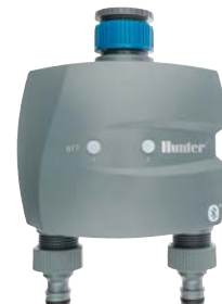
BTT-201 Einlaufdurchmesser: ¾" und 1" Auslaufdurchmesser: ¾" Höhe: 15,7 cm Breite: 13,5 cm Tiefe: 7,6 cm