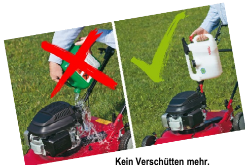
Kein Verschütten mehr, einfach und sauber tanken