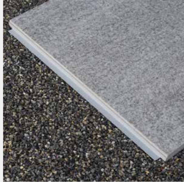
Querprofil nach 1. Platte