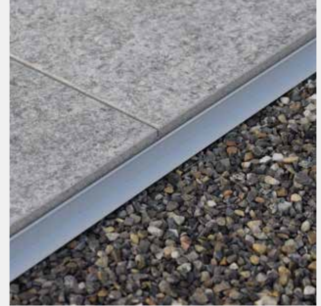
Längsprofil nach 1. Plattenreihe