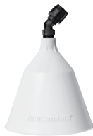
Sprühschirm ø 12.5 cm, steckbar Art.Nr. 11864801