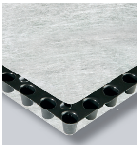
ND DP 12 Drainageplatte Nahansicht

Leistungsstarkes CE-markiertes Drainageplatte mit innovativer Noppenform aus schlagfestem Recycling-Polystyrol. Der Kern der ND DP12 Drainageplatte ist eine perforierte, diffusionsoffene, hochbelastbare Noppenfolie mit einer Bauhöhe von ca. 12 mm die eine ausgezeichnete Kriechfestigkeit verleiht, die für eine beständige, langfristige Entwässerungsleistung sorgt. Die Drainageplatte hat ein Wasserspeichervolumen von ca. 3,6 l/m 2 .