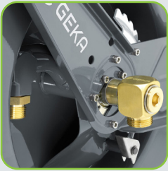
GEKA® plus Armatur und Rohr mit vollem 3/4" Wasserdurchfluss