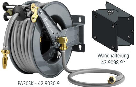
PA30SK - 42.9030.9