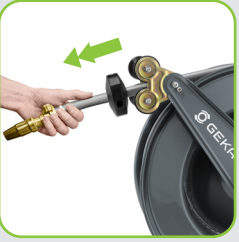
Arretierung durch Zug am Ende des Schlauchs steuerbar