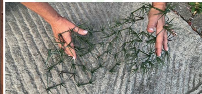
1. Auffächern des Netzes