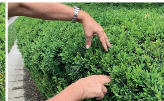
3. Eindrücken des Netzes