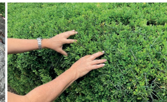
2. Auflegen des Netzes