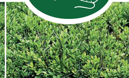
4. Spikes kaum im Buchs sichtbar