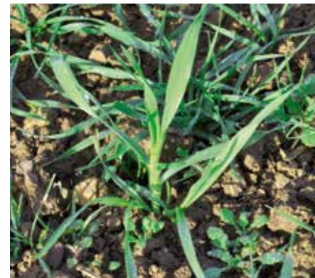
Flughafers ( Avena fatua )