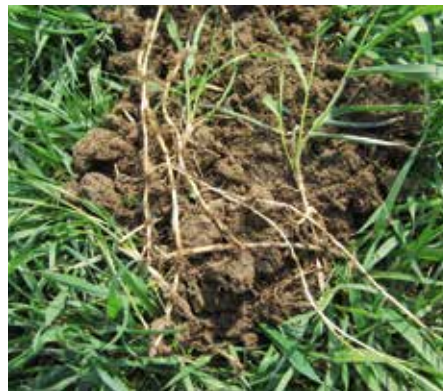
Gemeine Quecke ( Elymus repens )

Schnellere und erhöhte Wirkstoffaufnahme dank ISOLink- Technologie